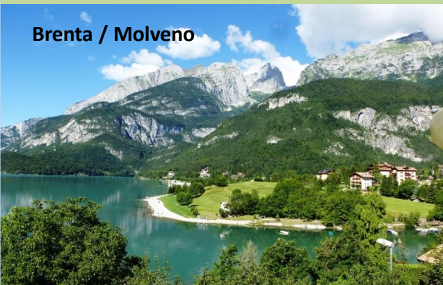
Brenta / Molveno

Buchungscode: MODANDTOR15 Telefonische Beratung unter: +49 (0) 173 984 2074 andreas.dietzsch@modi-biking.de