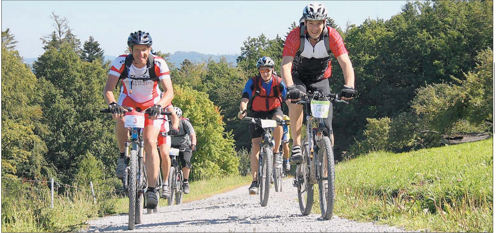
Die Kochertal Classics führen auf ausgewählten Pfaden durch die Gemeinden Sulzbach-Laufen, Gschwend, Eschach und Abtsgmünd.

SONNTAG, 9. SEPT. ab 10 Uhr „Junior Classics“, Treffpunkt der Teilnehmer ab 11 Uhr Start der Junioren an der „Krone“ „Test the Best“ – Bike-Testtag: „Bergamont“ und „Specialized“ stellen Testräder aus. Eine Teststrecke ist ausgeschildert. – Hocketse an der „Krone“