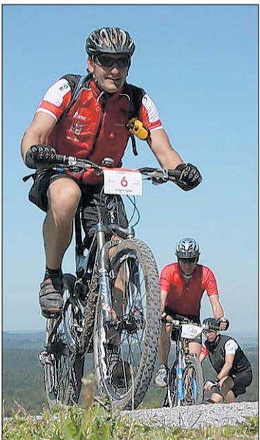
Gleich ist der Anstieg geschafft: Biker auf Tour durchs Limpurger Land.