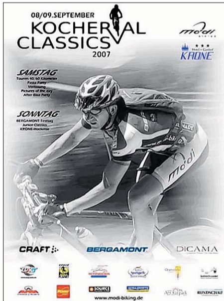
Das offizielle Plakat der Kochertal Classics 2007, der nunmehr vierten Großveranstaltung.

Streckenlänge: Große Runde 63 Kilometer und 1007 Höhenmeter, kleine Runde 46 Kilometer und 690 Höhenmeter.