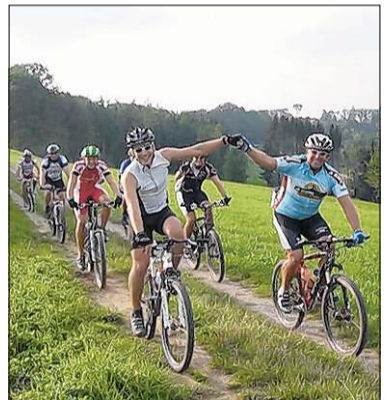
Erfolgreiche Tests: Auch die Tourguides sind von der Strecke begeistert.

Anmeldung/Pasta-Party: Hotel „Krone“, Sulzbach.